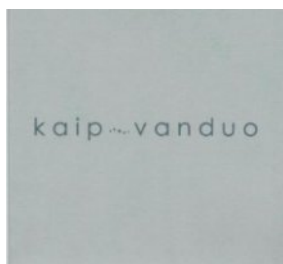
Pav. Dokumentinio filmo Kaip vanduo viršelis.

medžiagą. Projekto metu Nacionalinė UNESCO komisija drauge su Lietuvos liaudies kultūros centru surengė dvi pamainas pedagogams, norintiems giliau pažinti etninę kultūrą, praturtinti patirtį bei rasti kūrybinį įkvėpimą savo pedagoginei veiklai. Projektą apibendrinantis filmas sukurtas remiantis asmeninėmis istorijomis apie tradicinės kultūros, papročių, amatų, muzikos poveikį, įtaką visiems, kas su tuo artimiau susiduria. Filmą platinamas visiems susidomėjusiems.